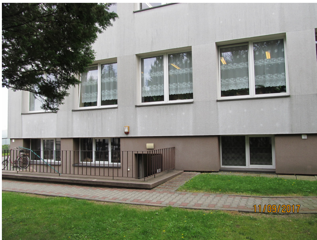
Widok 2- Elewacja wschodnia przebudowywanej szkoły (nie ulega zmianie)